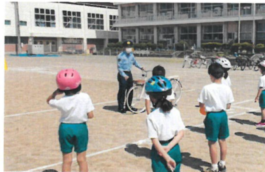
（3年 自転車の乗り方の指導）