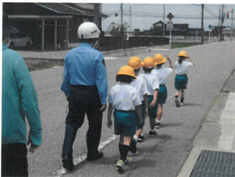
（1、2年 安全な歩行の仕方）

児童は1、2年混合のグループで歩行し、ポイントに立っている職員から道路の端を歩き、広い道路に出るときの安全確認の仕方等の指導を受けながら、真剣な態度で参加していました。