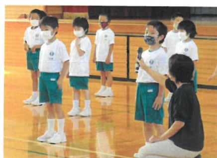
（6月5日 1年生の自己紹介）