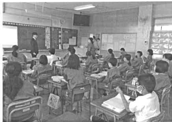
6年国語「漢字の形と音・意味」