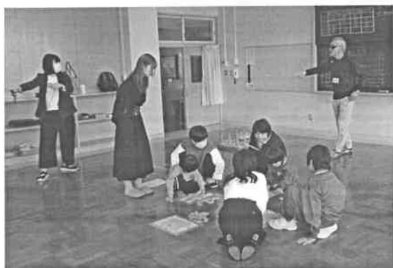
あおぞら級・ひまわり級 自立活動「ゲーム大会をしよう」