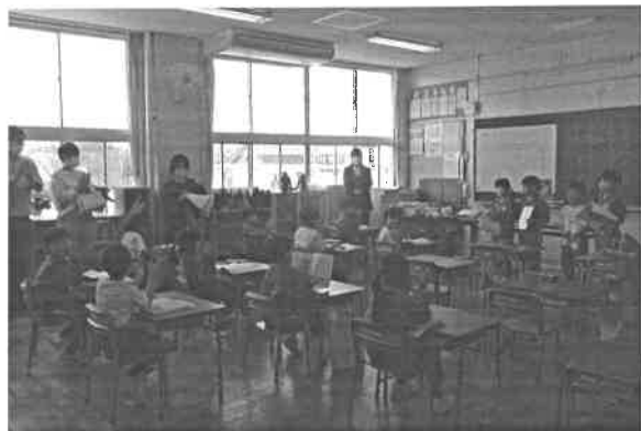
2年国語「ふきのとう」