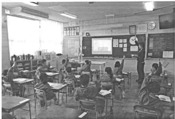
1年国語「あさのおひさま」

4月20日(土)の学習参観、学級懇談会、PTA総会には、お忙しい中ご参加いただきありがとうございました。子供たちは、ちょっぴりドキドキしながらも、保護者の皆様の温かいまなざしに見守られ、一生懸命に学習に取り組んでいました。