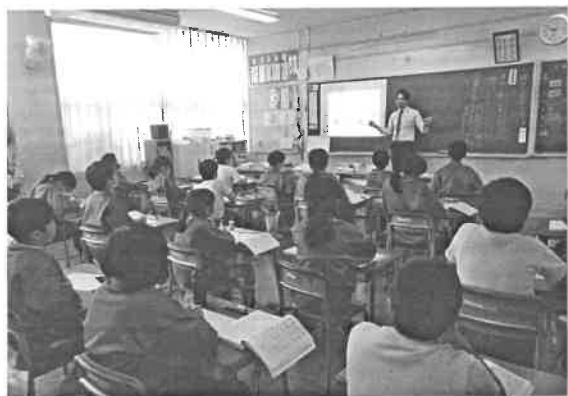
5年国語「漢字の成り立ち」