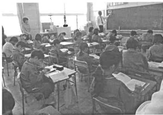
4年国語「白いぼうし」