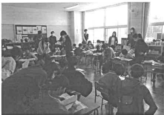
3年国語「国語辞典を使おう」