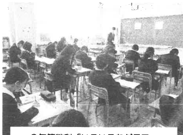
6年算数科「いろいろなグラフ」