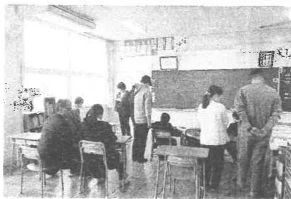
あおぞら級算数科「それぞれの学習に取り組もう」