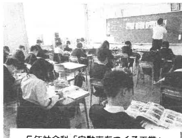
5年社会科「自動車をつくる工業」