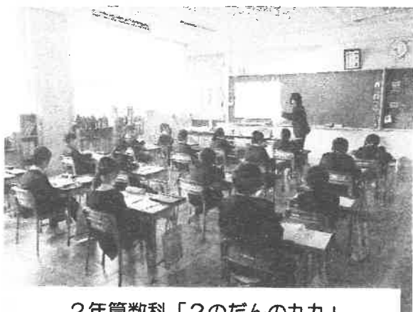
2年算数科「2のだんの九九」