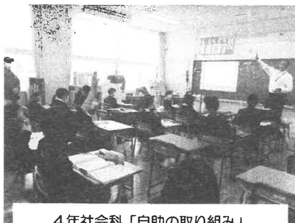
4年社会科「自助の取り組み」