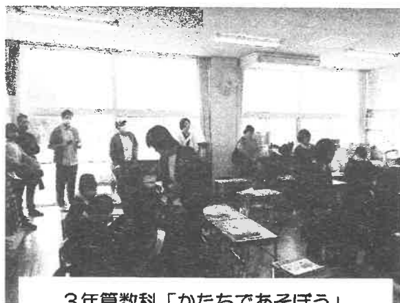
3年算数科「かたちであそぼう」