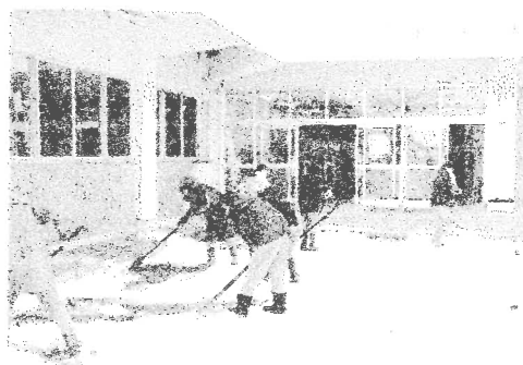
みんなのために！～6年生奉仕活動～

令和6年度も残り1か月ほどです。この間に、6年生は、一人一人が持っている「萩生小学校の『伝統』というバトン」を「これまでの感謝」と「未来を切り拓いていこうとする決意」等をもって引き継ぎ、下級生は、「これまでの感謝」と「学校を引き継いでいく決意」「6年生へのエール」等をもって引き継いでほしいと願っております。