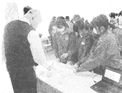
ものづくりへの思いに触れました