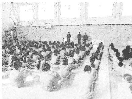
避難訓練はいつも真剣に

今月も荻っ子が「やさしく・かしこく・たくましく」がんばる姿がたくさん見られました。その中から、地域の方々とのつながりの中で学ぶ姿を3つご紹介します。12日(水)に避難訓練(不審者対応)を行いました。黒部警察署の方より不審者から身を守るための話を聴きました。体育館へ避難の様子はとても落ち着いており、一人一人が「自分のいのちは自分で守る」という真剣な気持ちで取り組んだことが伝わりました。14日(金)にふるさとキャリア教育を行いました。地元企業の方を講師にお招きし、6年生が「地元で長くものづくりを続ける方々の思い」に耳を傾けました。初めて知ること・考えることがよい刺激となり、もっと知りたいという思いが高まりました。そして、19日(水)には保小交流会を行いました。1年生が来年度入学予定の年長児を招待し、校内探検や鬼ごっこ等を通して交流を深めました。相手のことを考え、はりきって準備をする姿や声をかける姿は頼もしく、この1年間での成長をはっきりと感ずることができました。有意義な時間を共に創っていただきありがとうございました。